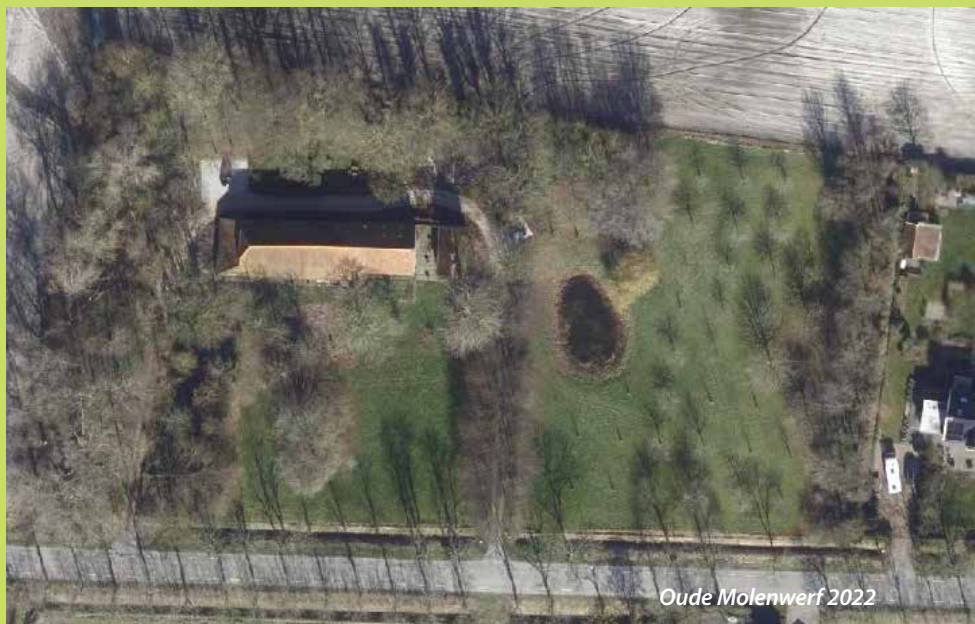
Oude Molenwerf 2022