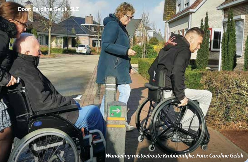
Wandeling rolstoelroute Krabbendijke.

Heerlijk wandelen is niet voor iedereen vanzelfsprekend en makkelijk te doen. Want als je in een rolstoel zit, afhankelijk bent van een rollator of een kinderwagen bij je hebt, kom je soms voor vervelende verrassingen te staan.