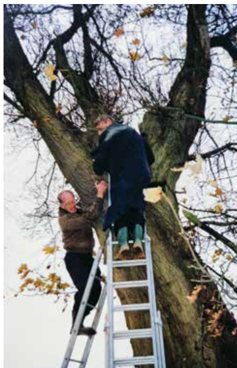
Commissaris van de koningin hangt steenuilenkast in oude wilg.

En omdat de commissaris er nu toch was, mocht hij ook nog een steenuilenkast ophangen in een oude wilg. Hij vond het wel hoog, maar liet zich niet kennen.