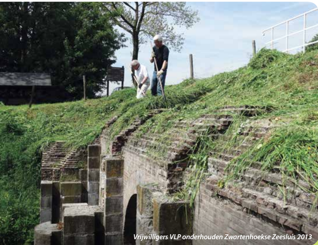
Vrijwilligers VLP onderhouden Zwartenhoekse Zeesluis 2013