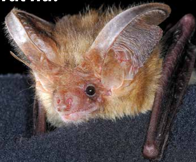
Gewone grootoorvleermuis.

Relatief veel oude en monumentale gebouwen worden bewoond door vleermuizen. Juist omdat de gebouwen oud zijn, is periodiek onderhoud nodig. In veel gevallen is het nodig om hiervoor een vergunning aan te vragen. Wat minder bekend is, is dat er ook altijd gecheckt moet worden of er een ontheffing nodig is voor de Wet natuurbescherming. Hiermee kan (ver-)bouwvertraging worden voorkomen. Daarbij wordt gekeken of er beschermde soorten aanwezig zijn. Beschermde soorten mogen niet (opzettelijk) gedood, verstoord,