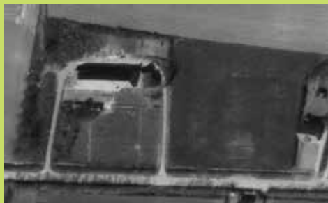
Oude Molenwerf 1970

Boerenerven zijn beeldbepalend voor het Zeeuwse platteland. En naast cultuurhistorisch waardevol vaak een groene oase voor flora en fauna. Een voorbeeld van een erf waarvan de erfbeplanting de afgelopen 40 jaar flink is uitgebreid is De Oude