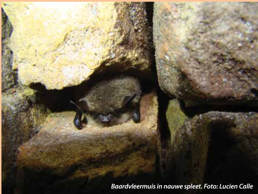
Baardvleermuis in nauwe spleet.

en, zoals Provincie Zeeland, gemeentes, kerkbesturen, Zoogdiervereniging en plaagdierbestrijders. Ook is daarbij gekeken naar wat er nodig is om deze knelpunten te voorkomen. Op korte termijn organiseert SLZ een tweede bijeenkomst waarbij met Provincie Zeeland en gemeentes meer in detail naar deze problematiek gekeken gaat worden. Ook wil SLZ aan gemeentes en provincie een handreiking bieden door middel van een flyer die men kan meegeven aan kerkbesturen of mensen die hun woning gaan renoveren of verbouwen. Hopelijk wordt daarmee in de toekomst een betere bescherming gegarandeerd.