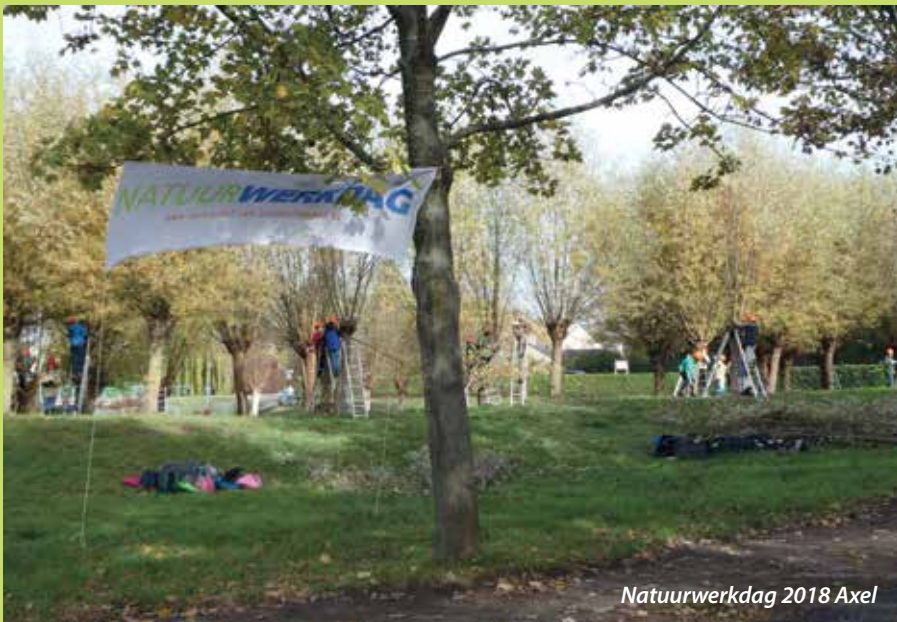
Natuurwerkdag 2018 Axel