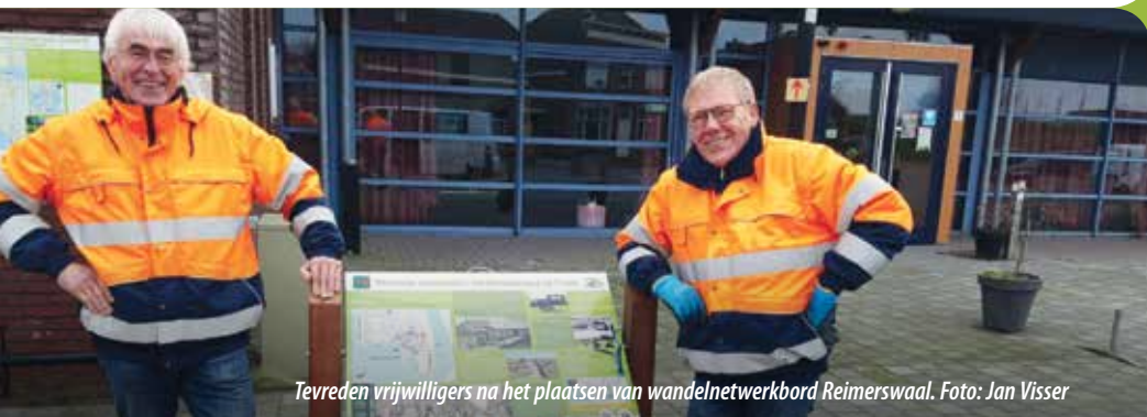
Tevreden vrijwilligers na het plaatsen van wandelnetwerkbord Reimerswaal.