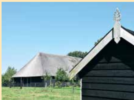
Hoofdschuur en geitenhok Hof Tiengemeten

Van Hof Tiengemeten zijn de schuurdelen nagenoeg versteend door een dikke laag teer. Op warme dagen kan dat zwarte handen geven. Op het ach-