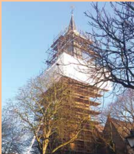
Restauratie kerk (niet die uit het artikel)

Wet natuurbescherming. Bij een onthef- ting wordt er een uitzondering op een wettelijk verbod gemaakt. Kraamkolonies zijn in Nederland vaak in spouwmuren, in gebouwen, achter betimmering en dak- lijsten, of onder dakpannen aanwezig.