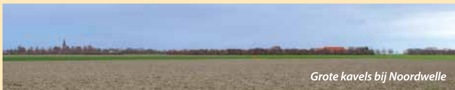
Grote kavels bij Noordwelle

scheuren en zelfs een enkeling die omvalt. De verklaring van de verjongingscyclus waar we nu in zijn beland. Voor de landbouw heeft de ramp ook vergaande gevolgen gehad. Door het slib was er weinig terug te zien van de bestaande verkaveling. Sloten waren verdwenen en complete boerderijen weggeslagen. Het ideale moment om de zaken opnieuw te ordenen. Dat heeft geresulteerd in grootschalige herverkaveling, waardoor boeren niet langer met allerlei versnipperde stukjes hoefden te werken. Overigens heeft bij de inundatie van Walcheren, tijdens de 2e wereldoorlog, deze herverkaveling ook plaatsgevonden. Al is daar in het nieuwe landschapsontwerp bewust rekening gehouden met plaats voor recreatie en behoud van natuurschoon. Waar dat normaliter met kleine stapjes gaat, konden er nu flink 'meters gemaakt worden'. De grote kavels op Schouwen-Duiveland, Tholen, Sint Philipsland en Goeree-Overflakkee zijn hier het zichtbare bewijs van. Vergelijk dat met het kleinschalige landschap in gebieden die gespaard zijn gebleven op Zuid-Beveland en je kunt lezen hoe de ramp haar sporen zichtbaar heeft nagelaten in ons landschap.