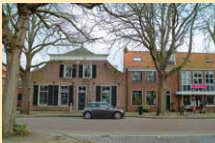
Monumentale bomen aan de Noordstraat te Burgh-Haamstede.

uitzondering had het geluk op hoogte te staan of net ver genoeg van overstroomd gebied af. Zo herken je op Schouwen-Duiveland duidelijk de lijn van Renesse naar Burgh-Haamstede waar nog monumentale bomen te vinden zijn, overeenkomstig met de hoogte waar het water geen vat op heeft gehad.