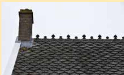
Woonhuis boerderij Overduin

en bewerkte windveren. Van de hoofdschuur van Overduin (1857) is één dak helft gedekt met tenminste 11.000 gesmoorde Oegstgeester dakpannen, ook wel beverstaarten genoemd. Het gebruik van deze sierlijke pan, soms in combinatie met nokruitertjes – zoals bij de boerenwoning van Overduin en bij het woonhuis van Klein Zeeduin – was duurder dan bijvoorbeeld een rieten kap. En dat is nog steeds zo! De drie bijzondere boerderijen behoren wat ons betreft zeker tot de top tien van Walcheren.