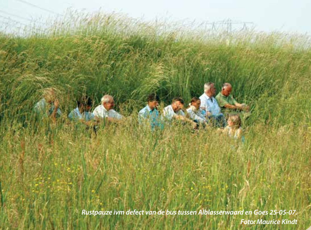
Rustpauze ivm defect van de bus tussen Alblasserwaard en Goes 25-05-07.