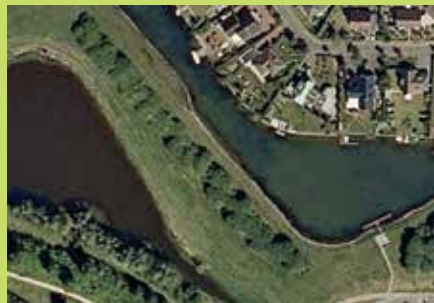
Goese Diep 2007

Minstens even belangrijk als een goede inrichting van een terrein is een natuurvriendelijk beheer. Op bovenstaande luchtfoto's is het effect te zien van ecologisch maaibeheer op een natuurterreintje in het Goese Diep. Op de luchtfoto uit 2022 is te zien hoe de bosrand een meer organische vorm