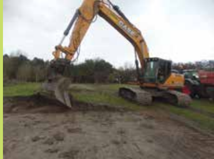
Plaggen in Open Duinen ikv PAS

'snoei hoogstamfruitbomen'. De WCL en de SLZ projecten kregen later een vervolg via het Nationaal landschap in meer gebieden in Zeeland. Er werden ook kleine cultuurhistorische elementen opgeknapt zoals bakkeetjes, varkenshokken en toegangshekken.