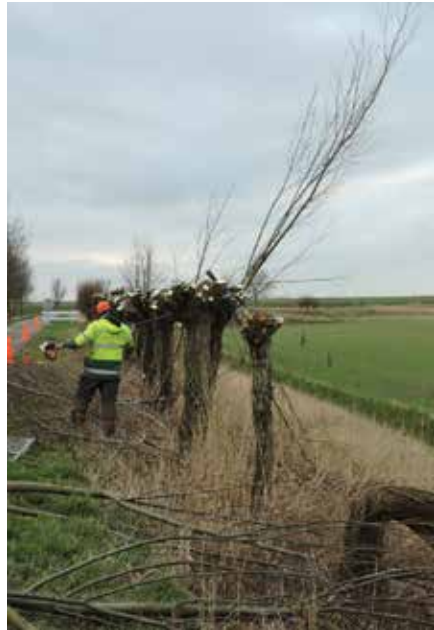
Knotploeg SLZ dijk familie Bom.

We hebben de werkzaamheden aan de dijk ingedeeld in drie groepen zodat ieder jaar, bij roulatie, een groep wordt aangepakt. Het is voor de groep best veel werk, daar de knotwilgen er inmiddels alweer 30 jaar staan en van plan zijn nog ouder te worden. Maar dat is goed, want het is gezellig als de maandaggroep er is want de tijd vliegt om. Dus kunnen ze ieder jaar terugkomen. Mannen dank je wel.