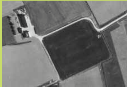
Hof Ravestein 1970

Ondanks dat we als SLZ geen eigen terreinen hebben, zijn we in de loop der jaren op talloze plekken in Zeeland betrokken geweest bij landschappelijke ontwikkelingen. Vaak kleinschalig, bijvoorbeeld op boerenerven. Maar soms ook op landgoederen of in natuurgebiedjes. Ons jubileumjaar is een mooie aanleiding om eens het licht te laten schijnen op een drietal succesverhalen; plekken in het landschap die de afgelopen 40 jaar een metamorfose hebben doorgemaakt in de positieve zin van het woord.