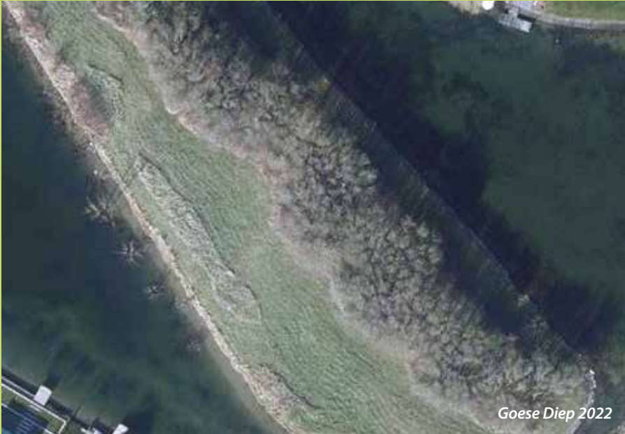
Goese Diep 2022

Molenwerf, een boerenhoeve gedaateerd Anno 1700. Hier zijn in de loop der jaren onder meer een hoogstamboomgaard, een poel, laanbomen en hagen aangelegd. Bijzonder is dat dit onder meerdere eigenaren is gebeurd. In 2013 werd dit historische erf bekroond met de Erftroufee.