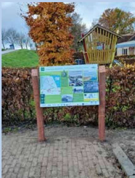
Wandelbord in Oostdijk bij De Putter, met rechtsonder het kaartje van de rolstoelroute in Oostdijk.

De Rolstoel- en Rollatorvriendelijke wandelroutes in de gemeente Reimerswaal zijn mogelijk gemaakt door Gemeente Reimerswaal, Geopark Schelde Delta/Provincie Zeeland, Zorggroep Ter Weel, VSB fonds, De Versterking, ANWB en Stichting Landschapsbeheer Zeeland.