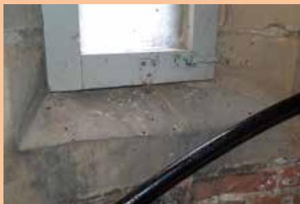
Uitwerpselen vleermuis op zolder.

matie te delen en draagvlak te creëren voor bescherming van vleermuizen. Om in beeld te brengen tegen welke problemen we in de praktijk aanlopen heeft er in 2021 een startbijeenkomst plaatsgevonden voor betrokken partij-