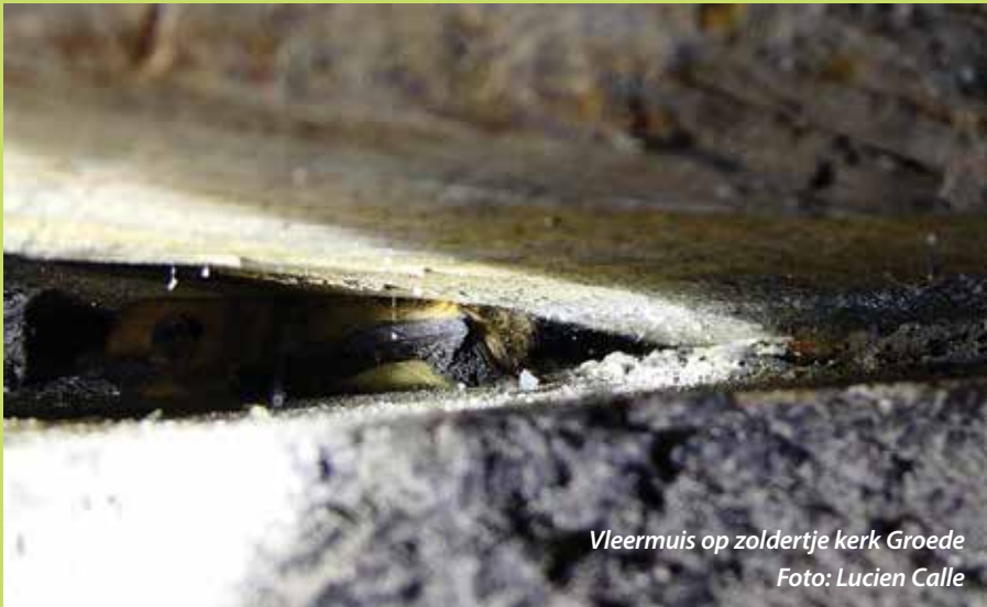
Vleermuis op zoldertje kerk Groede