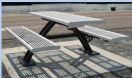
Picknick Rolstoel Tafel

“Als extra toevoeging wordt binnenkort op elke route een speciale rolstoel-picknick set geplaatst” kondigde wethouder Meeuwssen aan. Hiervan zijn twee verschillende varianten: een picknickset waar een rolstoel aan de kopskant kan aanschuiven zonder tegen tafelpoten o.i.d. aan te zitten en een losse tafel met aan één zijde een bankje.