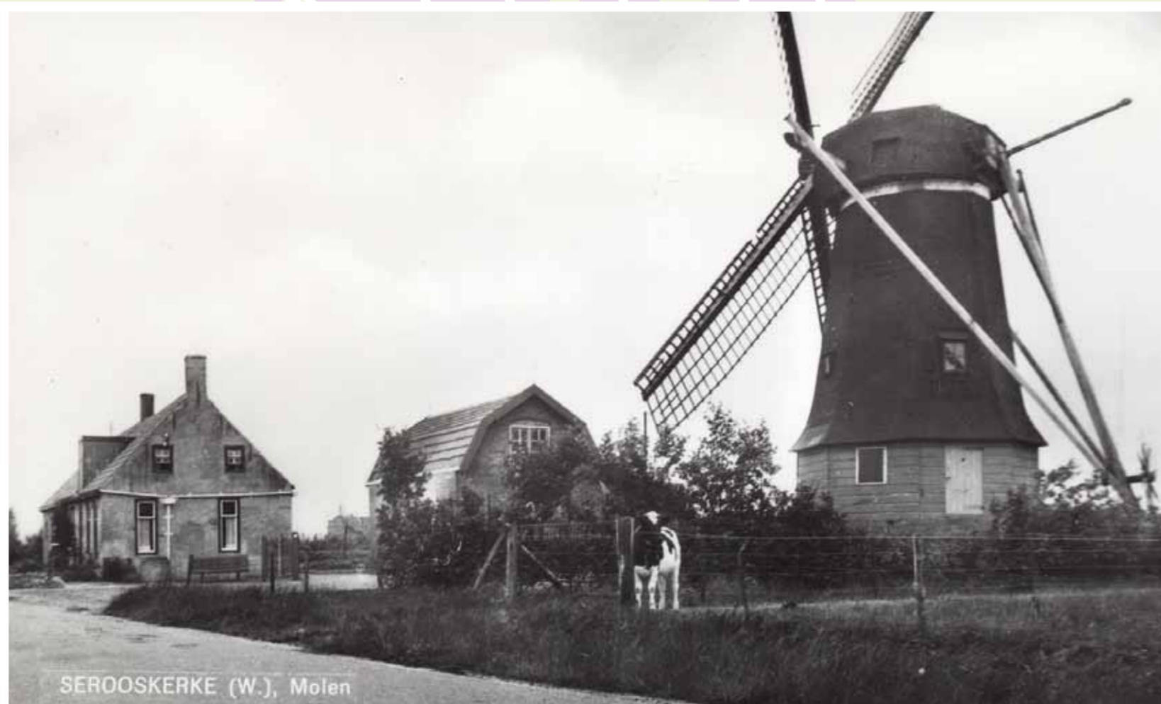
SEROOSKERKE (W.), Molen

Op de hoek van de Molenweg/ Vrouwenpolderseweg werd in 1835, op een berg waarop eerder een standaardmolen stond, molen De Jonge Johannes gebouwd. Later werd de molen De Hoop genoemd. In 1984 werd de molen ongeveer 300 meter in noordoostelijke richting verplaatst. Bij de sloop van de molen kwam men er achter dat de achtkantige molen op de hoeken op stukken van grafzerken rustte. Sinds 2011 heet de molen weer De Jonge Johannes.