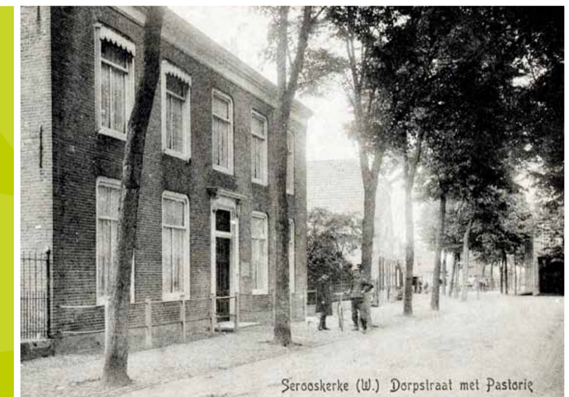
Serooskerke (W.) Dorpsstraat met Pastorie