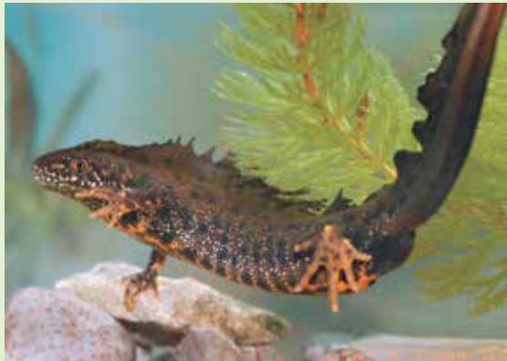
De kamsalamander (of grote watersalamander) komt vooral in Zeeuws-Vlaanderen voor, maar loopt in aantal sterk terug. Er worden biotopen ingericht of hersteld.