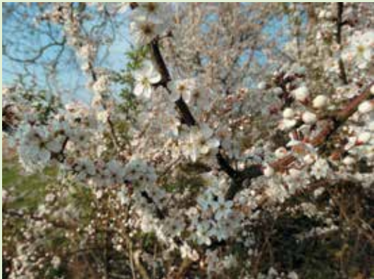
Een Zeeuwse haag met sleedoorn, geliefd bij veel insectensoorten en bij zangvogels om er een nest in te maken.

SLZ is goed thuis in de ecologie van dier- en plantsoorten van het agrarisch (of cultuur-)landschap en inventariseert regelmatig verschillende soorten die hier thuishoren, om zo een vinger aan de pols te houden. Er worden waar mogelijk passende maatregelen genomen om kwetsbare soorten te ondersteunen. En dat is hard nodig. Ook krijgen her en der in Zeeland bijvoorbeeld de meidoorn, karakteristieke heggen (de 'Zeeuwse haag'), steenuil, kamsalamander, rugstreeppad, patrijs en wilde bij een steuntje in de rug. SLZ draagt eraan bij dat de biodiversiteit toeneemt door kruidenrijke graslanden te ontwikkelen en op geschikte plekken bijna vergeten graansoorten te zaaien en oude fruitrassen te planten.