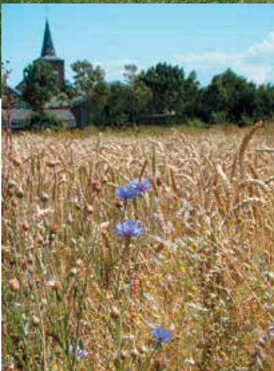
Cultuur- en natuurgewassen in één beeld nabij Ellewoutsdijk.