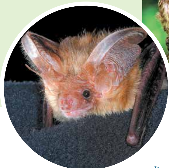
Voor onder meer de grootoorvleermuis worden bunkers ingericht. Ook bezoeken en controleren we kerkzolders, die van belang zijn voor vleermuizen om kraamkolonies te vormen.