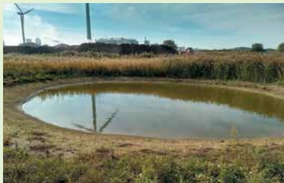
In samenwerking met de Zeeuwse Milieu Federatie en chemiebedrijf Dow Benelux te Terneuzen is bij dit bedrijf een perceel van 1,7 hectare kruidenrijk grasland ingezaaid en zijn er o.a. bijenhotels en voorlichtingspanelen geplaatst.