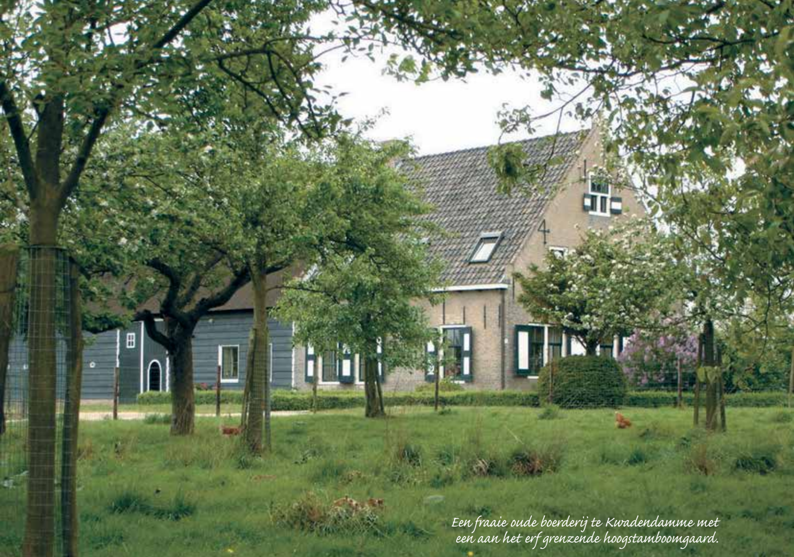
Een fraaie oude boerderij te Kwadendamme met een aan het erf grenzende hoogstamboomgaard.