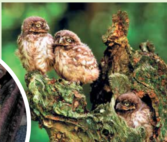
Jonge steenuilen op een oude knotwilg waar hun nest is. Omdat dergelijke natuurlijke nestmogelijkheden vaak ontbreken worden nestkasten opgehangen, ook voor kerkuilen.