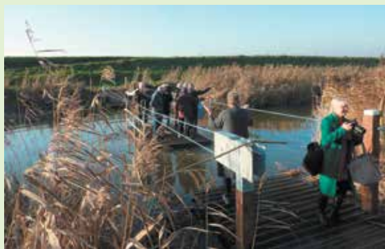
Ook een oversteek als deze, waarmee het wandelnetwerk op Tholen in 2019 werd verrijkt, is het resultaat van intensieve samenwerking tussen organisaties, landeigenaren en vrijwilligers.

SLZ ontvangt regelmatig Europese subsidies en als erkende goededoelenorganisatie ook giften van particulieren en organisaties zoals bijvoorbeeld de Nationale Postcodeloterij om een bepaald project uit te kunnen voeren.