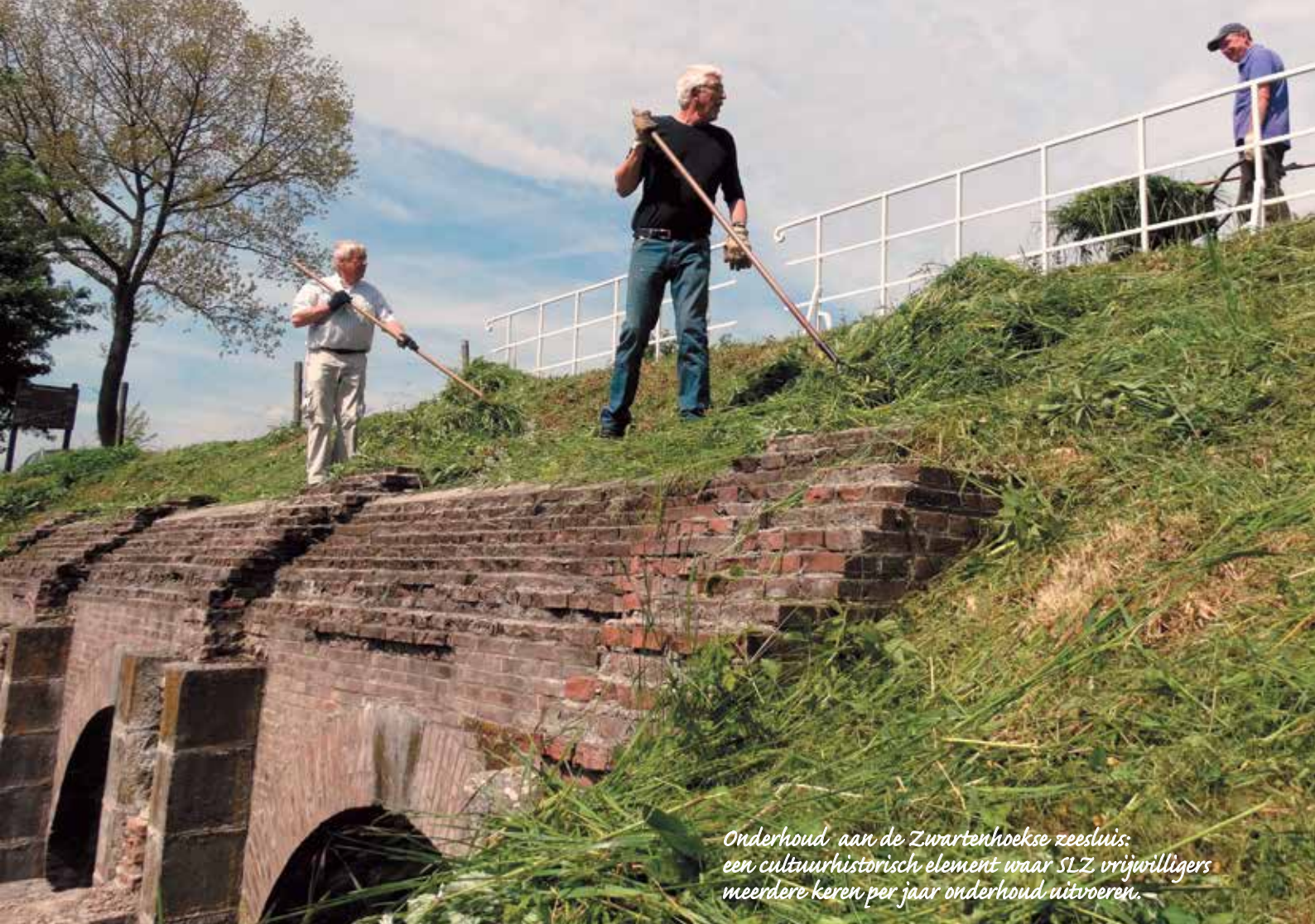
Onderhoud aan de Zwartenhoekse zeesluis: een cultuurhistorisch element waar SLZ vrijwilligers meerdere keren per jaar onderhoud uitvoeren.